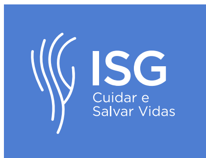
Pantone 2718 C