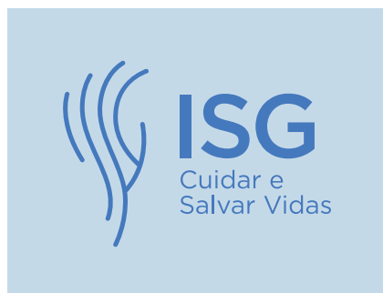
Pantone 290 C