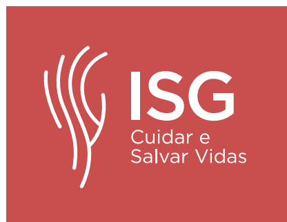
Pantone 7418 C