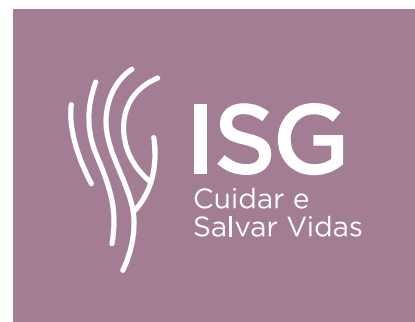
Pantone 5145 C