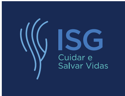
Pantone 295 C