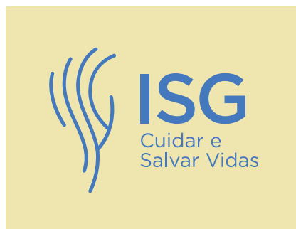
Pantone 461 C